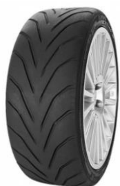
RS3-R / ZZR (15''-16'')