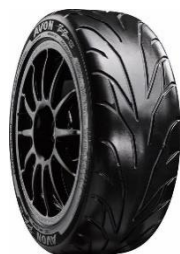
RS3-RS / ZZS (16'')